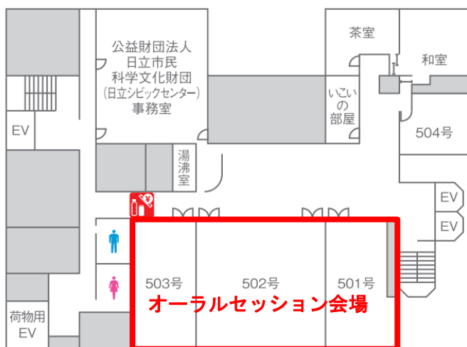
シビックセンターフロアマップ (5F)