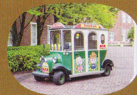
排気ガスとCO2を出さない電気自動車や電気バイクが街を走っています。