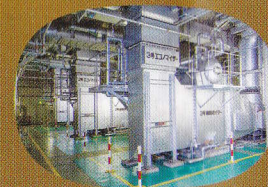
エネルギーロスを抑える「コ・ジェネレーションシステム」を見学できます。